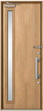
【おすすめ品番】 GST2-2(2/4)-P20-10-Z-R(L)-□□ 【カラー/ハンドル】 オーク/FIA