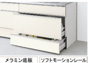
メラミン底板 ソフトモーションレール

※写真は化粧パネルです。 シルバー 加熱機器連動なし ADRタイプ ADR935SIRU