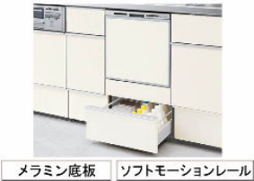
メラミン底板 ソフトモーションレール