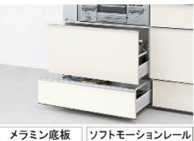
メラミン底板 ソフトモーションレール