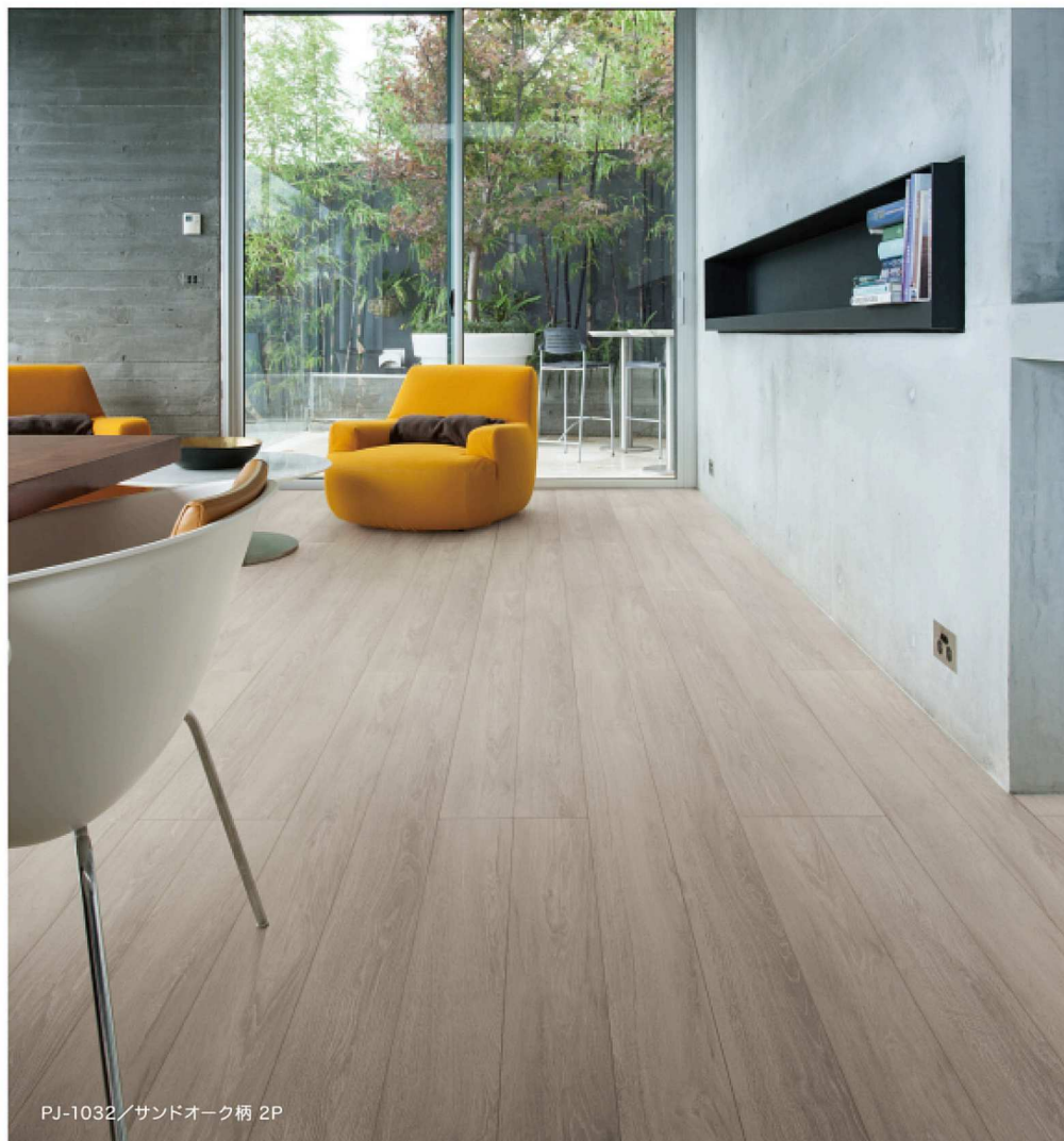
PJ-1032 / サンドオーク柄 2P

EBコーティングにより汚れに強く、傷がつきにくい。 パウダー仕上げを施し、木目を白く引き立たせた暖かみのある床材です。