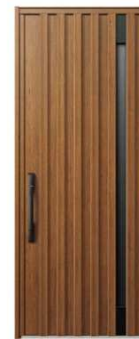
KE: キャラメルチーク