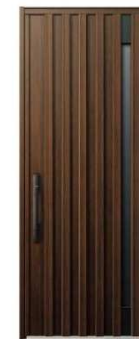
ZB: ショコラウォールナット