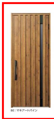
BE: マキアートパイン