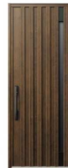
DP: ガナッシュウォールナット