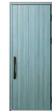
BJ: アイスブルーノーチェ