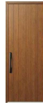
KE: キャラメルグレイク