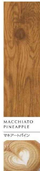
MACCHIATO PINEAPPLE マキアートバイン

〈枠 色〉BE: マキアートバイン 〈パネル色〉BE: マキアートバイン 〈ハンドル〉スマートコントロールキー ストレートハンドル(ブラック) 画像 No. DBUC4438NASG_L