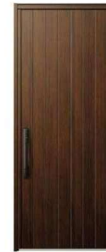
Z9: ショコラウォールナット