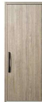
XP: ココナッツチェリー