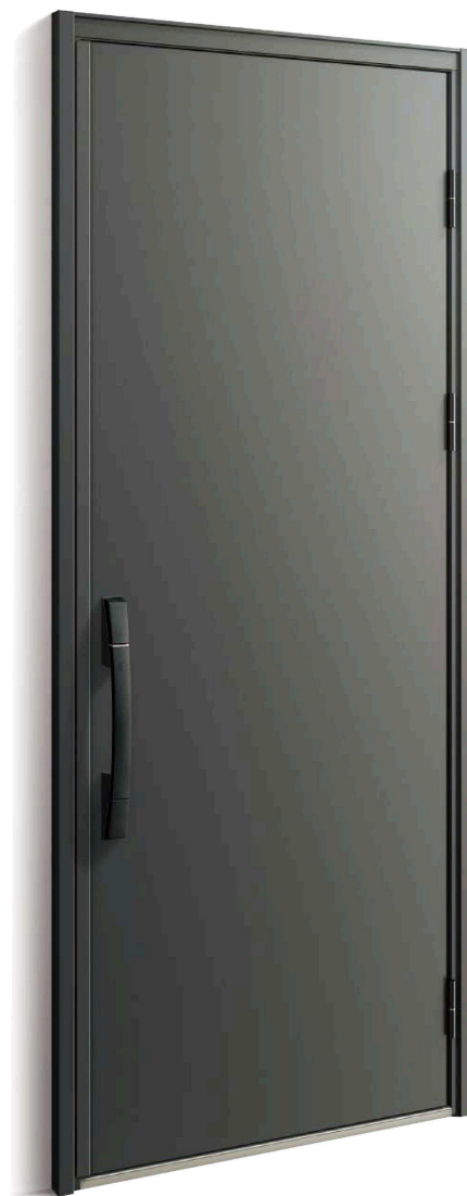
〈枠 色〉Z4：ディーブグレイ 〈パネル色〉Z4：ディーブグレイ 〈ハンドル〉スマートコントロールキー ストレートハンドル(ブラック) 画像 No.DBZ44198NA5C.L