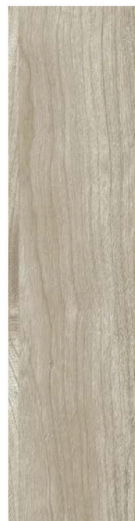
COCONUT CHERRY ココナッツチェリー