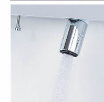
シャワー吐水 水ハネの少ない微細シャワーは従来比の20%の節水ができます。