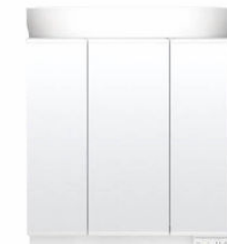
スタンダードLED照明・3面鏡・全収納 MEB-903TXSU