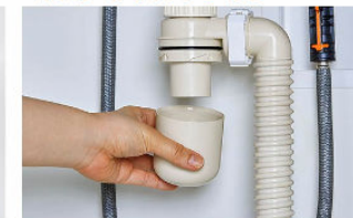
トラップのお掃除まで簡単