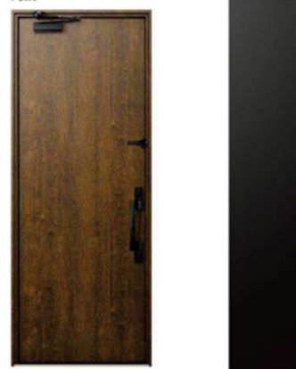
KS カーム ブラック