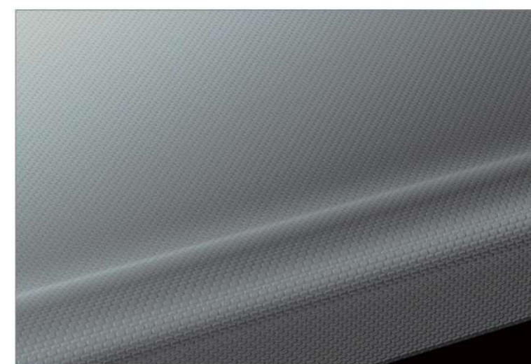
オーバルエンボス加工