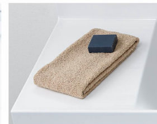
カウンターは 仮置きスペースにピッタリ。