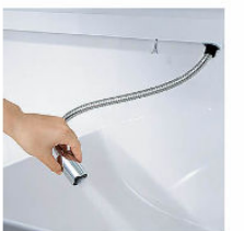
ホースを引き出して使えるので、ボウル手前に水を流すこともできます。