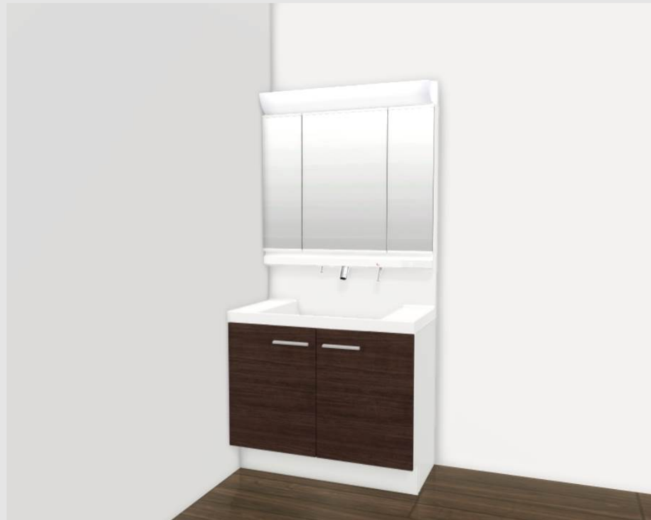
CG合成によるイメージ画像です。