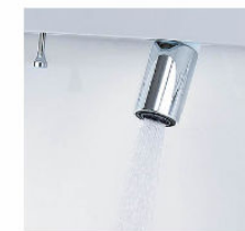
シャワー吐水 水ハネの少ない微細シャワーは従来比の20%の節水ができます。