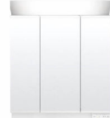
スタンダードLED照明・3面鏡・全収納 MEB-903TXSU