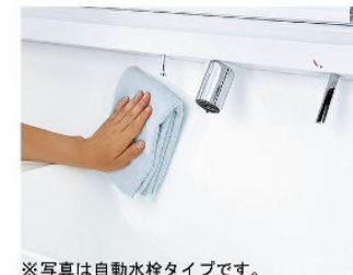
※写真は自動水栓タイプです。 一体成形カウンターで お手入れ簡単。