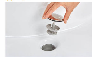
排水口の中までスポンジでサッとお掃除できます。 水を通しやすい大口径φ55の排水口です。