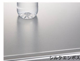
ステンレストップ