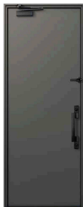
〈枠 色〉Z4：ディーブグレイ 〈ハンドル〉スマートコントロールキー 画像 No.DBZ44198NA5C.L 〈パネル色〉Z4：ディーブグレイ ストレーハンドル(ブラック) 画像 No.DBZ44198NA5C.L

■カラーバリエーション (LU, KR, H2色の枠色はH2色。A8, AF, HV, K5色の枠色はB7色。S1色の枠色はS1色)