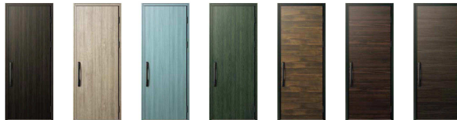
W6：炭炭 XP：ココナッツシェー BJ：アイスブルーノーチェ GS：オリーブグリーン A8：スモークビッコリー AF：ガトーアカシア HV：ビターストーン