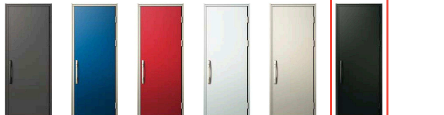
Z4：ディーブグレイ LU：サファイアブルー KR：ルビーレッド S1：ビュアシルバー H2：プラチナステン K5：カムブラック