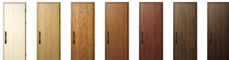
JJ：パニラウォールナット KG：ナチュラルオーク New BE：マキアートバイン KE：キャラメルチーク AM：ダーズリンウォールナット DP：ガナッシュウォールナット YA：ステインウォールナット New

■カラーバリエーション (LU, KR, H2色の枠色はH2色。A8, AF, HV, K5色の枠色はB7色。S1色の枠色はS1色)