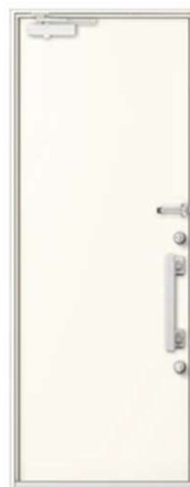
【おすすめ品番】 GST2-2(2/4)M17-10-Z-R(L)□□ 【カラー/ハンドル】 ナチュラルホワイト/F1A