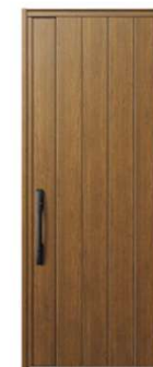
KE: キャラメルチーク