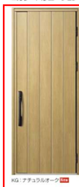
KG: アチュラルオーク