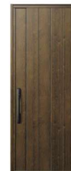
DP: ガッシュウォールナット