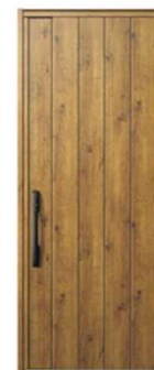
BE: マキアートバイン