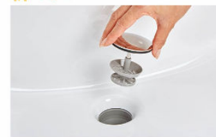
排水口の中までスポンジでサッとお掃除できます。 水を通しやすい大口径φ55の排水口です。