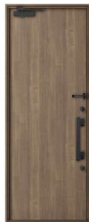
【おすすめ品番】 GST2(2/4)M18-10-ZR(L)□□ 【カラー/ハンドル】 チェスナット/F3A