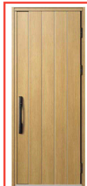
KG：ナチュラルオーク NEW