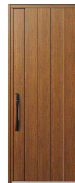
KE：キャラメルチーク