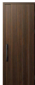
YA：ステインウォールナット NEW