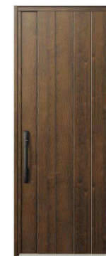
DP：ガナッシュウォールナット