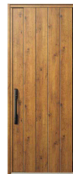
BE：マキアートパイン