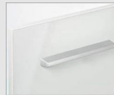
☑ YS2 クリエホワイト