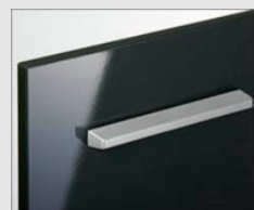
□ HD2 ディープグレー