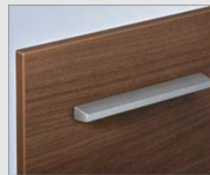
□ LM2 クリエモ