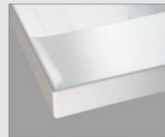
☑ H プレーンホワイト