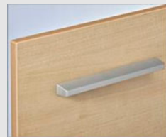
□ LP2 クリエール