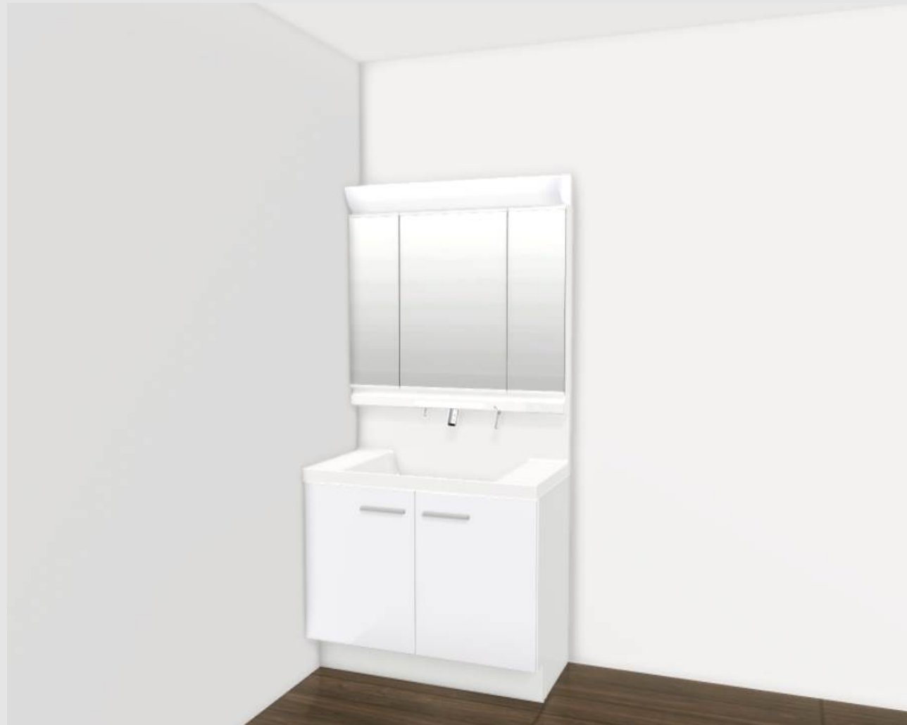
CG合成によるイメージ画像です。