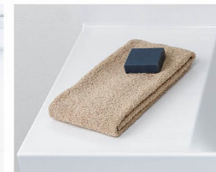
カウンターは 仮置きスペースにピッタリ。