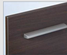
□ LD2 クリエダーク