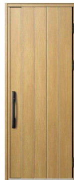
KG：ナチュラルオーク NEW