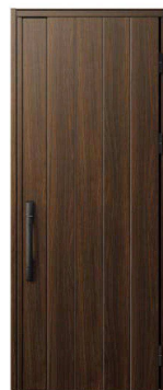
YA：ステインウォールナット NEW