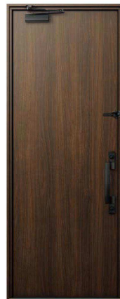
〈枠 色〉YA：ステインウォールナット 〈パネル色〉YA：ステインウォールナット 〈ハンドル〉スマートコントロールキー ストレートハンドル(ブラック) 画像 No.DBYA4146NASC_L