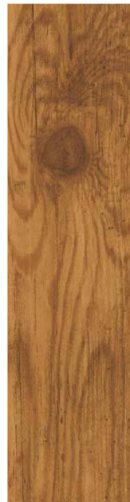
MACCHIATO PINEAPPLE マキアートパイン