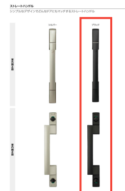
ストレートハンドル シンプルなデザインでどんなドアにもマッチするストレートハンドル。