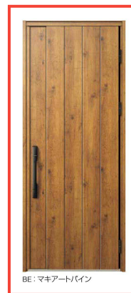
BE：マキアートパイン