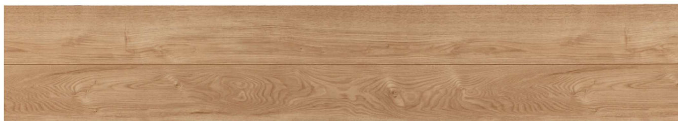
PJ-1036/ナチュラルオーク柄 2P